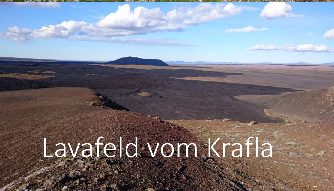
Lavafeld vom Krafla